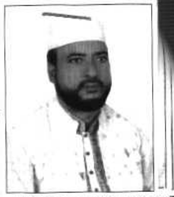
(এখানে সদস্য তৈরী প্রার্থীর ব্যক্তিগত পাসপোর্ট সাইজের এক কপি সত্যায়িত ছবি লগ্নাঙ্কিত হইবে)